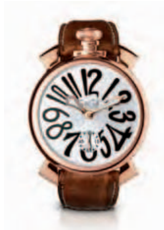
5011.6 _CASSA PLACCATA ORO ROSA, QUADRANTE SILVER SOLEIL, NUMERI NERI, SFERE PLACCATE ORO ROSA, CINTURINO COCCO BROWN

ROSE GOLD PLATED CASE, BLUE SOLEIL DIAL, ROSE GOLD PLATED NUMBERS AND SPHERES, BLUE CROCO PRINT STRAP