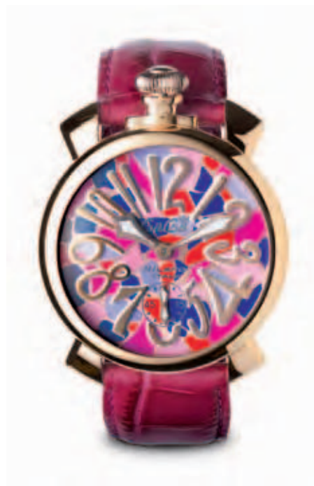
5011 MOSAICO 2 _CASSA PLACCATO ORO ROSA, QUADRANTE MOSAICO, NUMERI E SFERE PLACCATI ORO ROSA, CINTURINO CILIEGIA

ROSE GOLD PLATED CASE, MOSAIC DIAL, ROSE GOLD PLATED NUMBERS AND SPHERES, LILAC CROCO PRINT STRAP