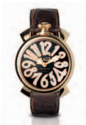
5021.3 _CASSA PLACCATA ORO ROSA, QUADRANTE MADREPERLA NERO NUMERI E SFERE ORO ROSA, CINTURINO COCCO TESTA DI MORO

ROSE GOLD PLATED STEEL CASE, MOTHER OF PEARL DIAL, ROSE GOLD NUMBERS, ROSE GOLD HANDS, LIGHT BROWN CROCO STRAP