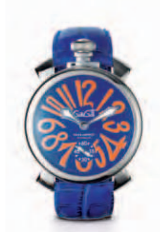
5010.8 _CASSA IN ACCIAIO, QUADRANTE SMALTO BLU, NUMERI ARANCIO, SFERE ACCIAIO, CINTURINO COCCO BLU

STAINLESS STEEL CASE, SILVER SOLEIL DIAL WITH BLACK NUMBERS, GOLD PLATED SPHERES, BLACK CROCO PRINT STRAP