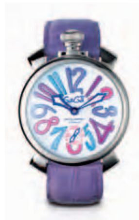
5010.9 _CASSA IN ACCIAIO, QUADRANTE BIANCO, NUMERI COLORS-LILLA, SFERE BLU, CINTURINO COCCO LILLA

STAINLESS STEEL CASE, BLUE DIAL, ORANGE NUMBERS, STAINLESS STEEL SPHERES, BLU CROCO PRINT STRAP