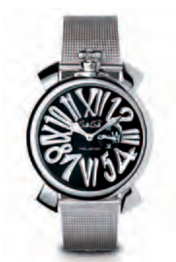
5080.2 _CASSA ACCIAIO SLIM, MOVIMENTO AL QUARZO, QUADRANTE NERO, NUMERI BIANCHI, BRACCIALE ACCIAIO MAGLIA MILANO

QUARTZ WATCH STEEL CASE BLACK DIAL WHITE NUMBERS STEEL BRACELET MAGLIA MILANO