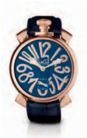
5011.5 _CASSA PLACCATA ORO ROSA, QUADRANTE BLU SOLEIL, NUMERI E SFERE PLACCATI ORO ROSA, CINTURINO COCCO BLU

ROSE GOLD PLATED CASE, BLUE SOLEIL DIAL, ROSE GOLD PLATED NUMBERS AND SPHERES, BLUE CROCO PRINT STRAP