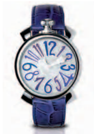
5020.3 _CASSA ACCIAIO, QUADRANTE MADREPERLA NUMERI COLORS BLU, SFERE ACCIAIO, CINTURINO COCCO BLU

STEEL CASE, BLACK MOTHER OF PEARL DIAL, MULTI-COLOUR NUMBERS, STEEL HANDS, RED CROCO STRAP