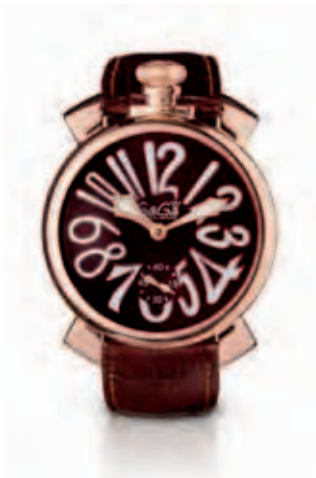
5011.1 _CASSA PLACCATA ORO ROSA, QUADRANTE CHOCOLATE SOLEIL NUMERI BIANCHI, SFERE PLACCATE ORO ROSA, CINTURINO COCCO CHOCOLATE

ROSE GOLD PLATED CASE, CHOCOLATE SOLEIL DIAL, WHITE NUMBERS, ROSE GOLD PLATED SPHERES, CHOCOLATE CROCO PRINT STRAP