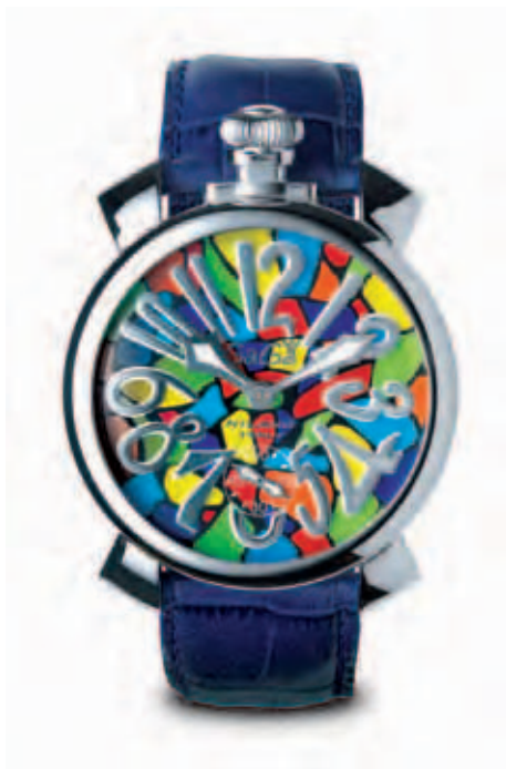
5010 MOSAICO 1 _CASSA ACCIAIO, QUADRANTE MOSAICO, NUMERI E SFERE ACCIAIO, CINTURINO IN COCCO BLU

STAINLESS STEEL CASE, MOSAIC DIAL, STAINLESS STEEL NUMBERS AND SPHERES, BLUE CROCO PRINT STRAP