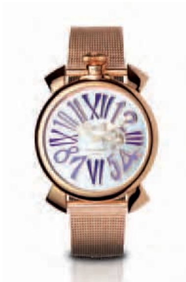
5081.3 _CASSA ACCIAIO SLIM PLACCATA ORO ROSA, MOVIMENTO AL QUARZO, QUADRANTE SILVER, NUMERI LILLA, BRACCIALE MAGLIA MILANO ORO ROSA

QUARTZ SLIM WATCH, ROSE GOLD PLATED CASE SILVER DIAL LILAC NUMBERS, ROSE GOLD BRACELET MAGLIA MILANO