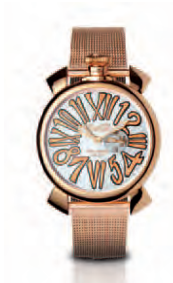
5081.2 _CASSA ACCIAIO SLIM PLACCATA ORO ROSA, MOVIMENTO AL QUARZO, QUADRANTE SILVER, NUMERI ORO, BRACCIALE MAGLIA MILANO ORO ROSA

QUARTZ SLIM WATCH, ROSE GOLD PLATED CASE SILVER DIAL LILAC NUMBERS, ROSE GOLD BRACELET MAGLIA MILANO