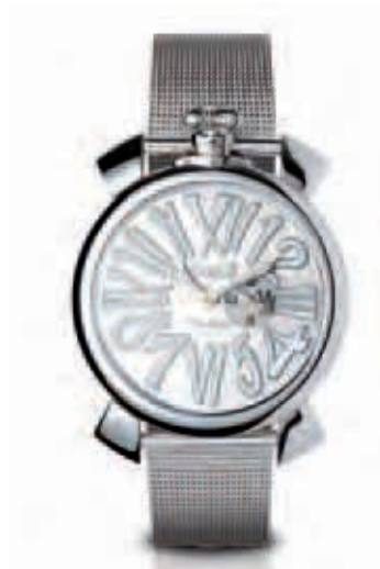
5080.3 _CASSA ACCIAIO SLIM, MOVIMENTO AL QUARZO, QUADRANTE SILVER, NUMERI ACCIAIO, BRACCIALE ACCIAIO MAGLIA MILANO

QUARTZ WATCH STEEL CASE BLACK DIAL WHITE NUMBERS STEEL BRACELET MAGLIA MILANO