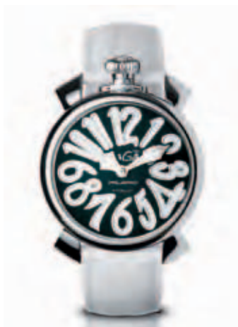
5020.4 _CASSA ACCIAIO, QUADRANTE MADREPERLA NERO NUMERI BIANCHI, SFERE ACCIAIO, CINTURINO COCCO BIANCO

STEEL CASE, MOTHER OF PEARL DIAL, BLUE COLOUR NUMBERS, SILVER HANDS, BLUE CROCO STRAP