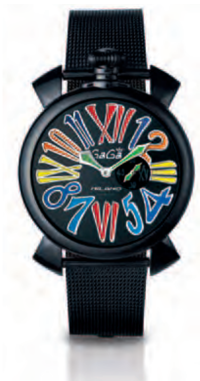
5082.1 CASSA ACCIAIO SLIM PVD NERO LUCIDO, MOVIMENTO AL QUARZO, QUADRANTE NERO NUMERI COLORS, BRACCIALE MAGLIA MILANO NERO LUCIDO

QUARTZ WATCH PVD CASE BLACK DIAL MULTICOLOR NUMBERS BLACK PVD BRACELET MAGLIA MILANO