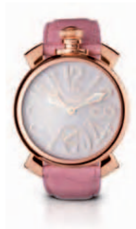
5011.2 _CASSA PLACCATA ORO ROSA, QUADRANTE ROSA MATT NUMERI BIANCHI, SFERE PLACCATE ORO ROSA, CINTURINO COCCO ROSA

ROSE GOLD PLATED CASE, CHOCOLATE SOLEIL DIAL, WHITE NUMBERS, ROSE GOLD PLATED SPHERES, CHOCOLATE CROCO PRINT STRAP