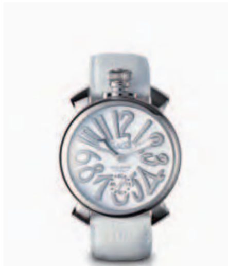
5010.10 _CASSA IN ACCIAIO, QUADRANTE BIANCO, NUMERI E SFERE ACCIAIO, CINTURINO COCCO BIANCO

STAINLESS STEEL CASE, BLACK DIAL WITH MULTICOLOR NUMBERS, STAINLESS STEEL SPHERES, BLACK CROCO PRINT STRAP