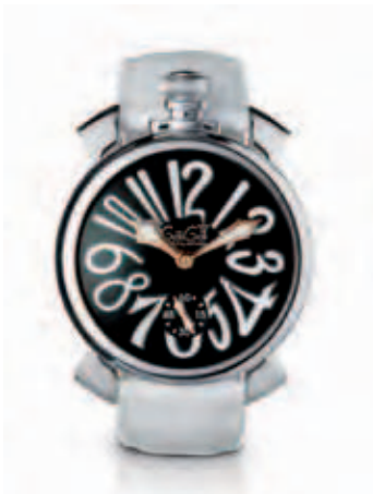
5010.6 _CASSA IN ACCIAIO, QUADRANTE IN SMALTO NERO, NUMERI BIANCHI, SFERE PLACCATE ORO, CINTURINO COCCO BIANCO

STAINLESS STEEL CASE, BLACK DIAL, WHITE NUMBERS, ROSE GOLD PLATED SPHERES, WHITE CROCO PRINT STRAP