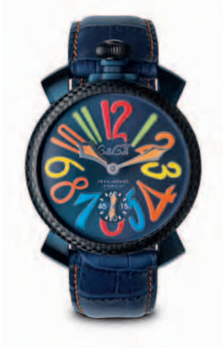
5016.4 _CASSA ACCIAIO TRATTAMENTO PVD BLU, LUNETTA IN FIBRA DI CARBONIO, QUADRANTE BLU SOLEIL NUMERI COLORS, SFERE ACCIAIO, CINTURINO COCCO BLU, LIMITED EDITION 500 PZ.

STAINLESS STEEL CASE WITH BLUE PVD TREATMENT, CARBON FIBRE RING, BLUE SOLEIL DIAL, MULTICOLOR NUMBERS, STEEL SPHERES, BLUE CROCO PRINT STRAP, LIMITED EDITION 500 PIECES.