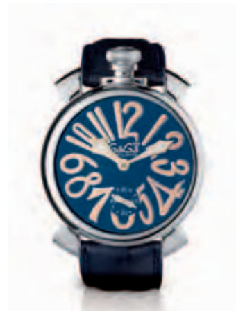
5010.5 _CASSA IN ACCIAIO, QUADRANTE BLU SOLEIL, NUMERI E SFERE PLACCATI ORO ROSA, CINTURINO COCCO BLU

STAINLESS STEEL CASE, BLACK DIAL STAINLESS STEEL NUMBERS AND SPHERES, BLACK CROCO PRINT STRAP