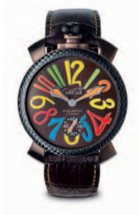
5016.5 _CASSA ACCIAIO TRATTAMENTO PVD COFFEE, LUNETTA IN FIBRA DI CARBONIO, QUADRANTE BROWN NUMERI COLORS, SFERE ACCIAIO, CINTURINO COCCO MARRONE, LIMITED EDITION 500 PZ.

STAINLESS STEEL CASE WITH BLUE PVD TREATMENT, CARBON FIBRE RING, BLUE SOLEIL DIAL, MULTICOLOR NUMBERS, STEEL SPHERES, BLUE CROCO PRINT STRAP, LIMITED EDITION 500 PIECES.