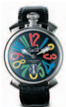
5010.2 _CASSA IN ACCIAIO, QUADRANTE SMALTO NERO, NUMERI COLORS, SFERE ACCIAIO, CINTURINO COCCO NERO

STAINLESS STEEL CASE, BLACK DIAL WITH MULTICOLOR NUMBERS, STAINLESS STEEL SPHERES, BLACK CROCO PRINT STRAP