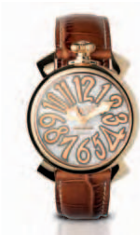
5021.2 _CASSA PLACCATA ORO ROSA, QUADRANTE MADREPERLA NUMERI E SFERE ORO ROSA, CINTURINO COCCO MIELE

ROSE GOLD PLATED STEEL CASE, MOTHER OF PEARL DIAL, ROSE GOLD NUMBERS, ROSE GOLD HANDS, LIGHT BROWN CROCO STRAP