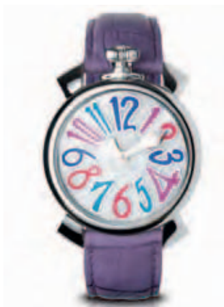
5020.7 _CASSA ACCIAIO, QUADRANTE MADREPERLA NUMERI COLORS LILLA, SFERE ACCIAIO, CINTURINO COCCO LILLA

STEEL CASE, MOTHER OF PEARL DIAL, PINK COLOUR NUMBERS, SILVER HANDS, PINK CROCO STRAP