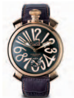
5011.7 _CASSA PLACCATA ORO ROSA, QUADRANTE GRIGIO SOLEIL NUMERI BIANCHI E SFERE PLACCATE ORO ROSA, CINTURINO COCCO GRIGIO

ROSE GOLD PLATED CASE, SILVER SOLEIL DIAL, BLACK NUMBERS, PINK GOLD PLATED SPHERES, BROWN CROCO PRINT STRAP