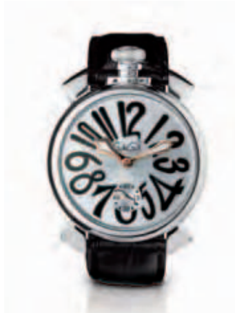
5010.7 _CASSA IN ACCIAIO, QUADRANTE SILVER SOLEIL CON NUMERI NERI, SFERE PLACCATE ORO, CINTURINO COCCO NERO

STAINLESS STEEL CASE, BLACK DIAL, WHITE NUMBERS, ROSE GOLD PLATED SPHERES, WHITE CROCO PRINT STRAP