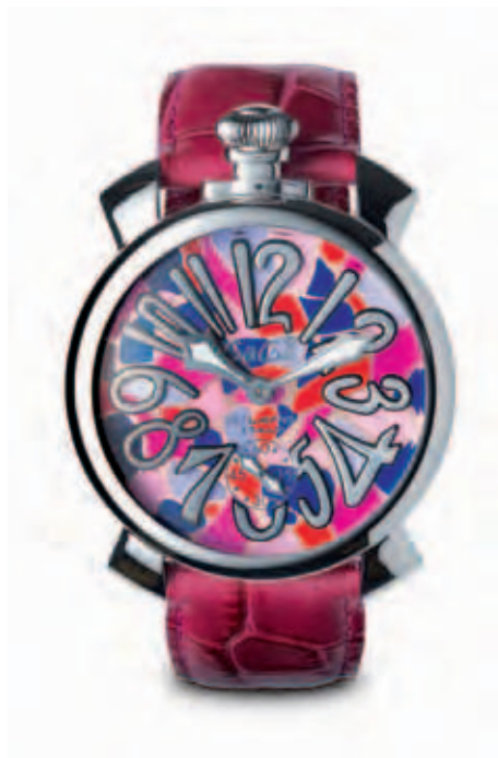
5010 MOSAICO 2 _CASSA ACCIAIO, QUADRANTE MOSAICO, NUMERI E SFERE ACCIAIO, CINTURINO CILIEGIA

STAINLESS STEEL CASE, MOSAIC DIAL, STAINLESS STEEL NUMBERS AND SPHERES, BLUE CROCO PRINT STRAP