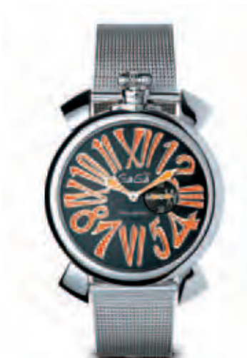
5080.4 _CASSA ACCIAIO SLIM, MOVIMENTO AL QUARZO, QUADRANTE GRIGIO SOLEIL, NUMERI ARANCIO, BRACCIALE ACCIAIO MAGLIA MILANO

QUARTZ WATCH STEEL CASE SILVER DIAL SILVER NUMBERS STEEL BRACELET MAGLIA MILANO