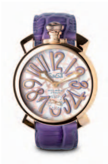
5011 MOSAICO 1 _CASSA PLACCATO ORO ROSA, QUADRANTE MOSAICO, NUMERI E SFERE PLACCATI ORO ROSA, CINTURINO IN COCCO LILLA

ROSE GOLD PLATED CASE, MOSAIC DIAL, ROSE GOLD PLATED NUMBERS AND SPHERES, LILAC CROCO PRINT STRAP