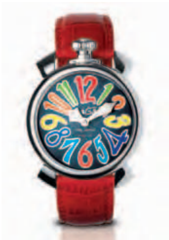
5020.2 _CASSA ACCIAIO, QUADRANTE MADREPERLA NERO NUMERI COLORS, SFERE ACCIAIO, CINTURINO COCCO ROSSO

STEEL CASE, BLACK MOTHER OF PEARL DIAL, MULTI-COLOUR NUMBERS, STEEL HANDS, RED CROCO STRAP