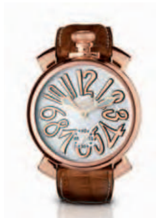
5011.8 _CASSA PLACCATA ORO ROSA, QUADRANTE SMALTO BIANCO, NUMERI E SFERE PLACCATI ORO ROSA, CINTURINO COCCO BROWN

ROSE GOLD PLATED CASE, GREY SOLEIL DIAL, WHITE NUMBERS, ROSE GOLD PLATED SPHERES, GREY CROCO PRINT STRAP