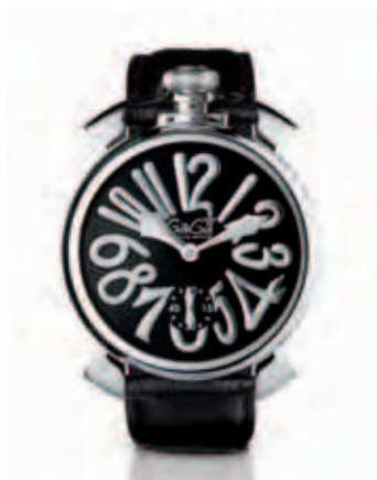
5010.4 _CASSA IN ACCIAIO, QUADRANTE SMALTO NERO, NUMERI E SFERE ACCIAIO, CINTURINO COCCO NERO

STAINLESS STEEL CASE, WHITE DIAL WITH STEEL NUMBERS, STAINLESS STEEL SPHERES, WHITE CROCO PRINT STRAP