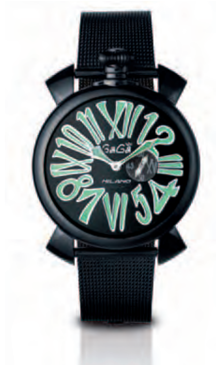
5082.2 CASSA ACCIAIO SLIM PVD NERO LUCIDO, MOVIMENTO AL QUARZO, QUADRANTE NERO NUMERI VERDI FLUO, BRACCIALE MAGLIA MILANO NERO LUCIDO

QUARTZ WATCH PVD CASE BLACK DIAL MULTICOLOR NUMBERS BLACK PVD BRACELET MAGLIA MILANO