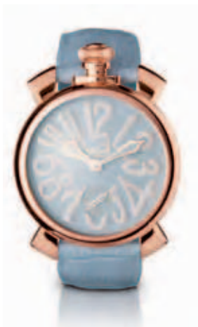
5011.3 _CASSA PLACCATA ORO ROSA, QUADRANTE AZZURRO MATT, NUMERI BIANCHI, SFERE PLACCATE ORO ROSA, CINTURINO COCCO AZZURRO

ROSE GOLD PLATED CASE, PINK MATT DIAL, WHITE NUMBERS, ROSE GOLD PLATED SPHERES, PINK CROCO PRINT STRAP