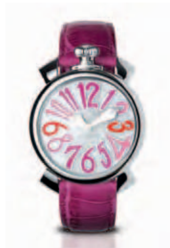
5020.6 _CASSA ACCIAIO,QUADRANTE MADREPERLA NUMERI COLORS ROSA, SFERE ACCIAIO, CINTURINO COCCO ROSA

STEEL CASE, MOTHER OF PEARL DIAL, BLACK COLOUR NUMBERS, SILVER HANDS, BLACK CROCO STRAP