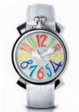
5020.1 _CASSA ACCIAIO, QUADRANTE MADREPERLA NUMERI COLORS, SFERE ACCIAIO, CINTURINO COCCO BIANCO

ROSE GOLD PLATED STEEL CASE, BLACK MOTHER OF PEARL DIAL, ROSE GOLD NUMBERS, ROSE GOLD HANDS, DARK BROWN CROCO STRAP