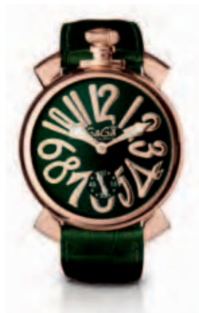
5011.4 _CASSA PLACCATA ORO ROSA, QUADRANTE VERDE SOLEIL, NUMERI E SFERE PLACCATE ORO ROSA, CINTURINO COCCO VERDE

ROSE GOLD PLATED CASE, LIGHT BLUE MATT DIAL, WHITE NUMBERS, ROSE GOLD PLATED SPHERES, LIGHT BLUE CROCO PRINT STRAP