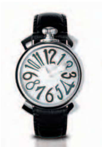
5020.5 _CASSA ACCIAIO,QUADRANTE MADREPERLA, NUMERI COLORS NERI, SFERE ACCIAIO CINTURINO COCCO NERO

STEEL CASE, MOTHER OF PEARL DIAL, BLACK COLOUR NUMBERS, SILVER HANDS, BLACK CROCO STRAP