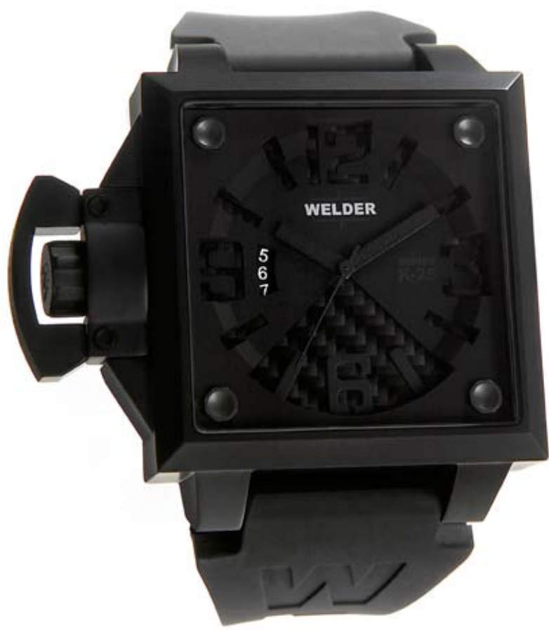
K25 4104 46x46 mm K25 4504 40x40 mm

MOVEMENT: 2115 Miyota. FUNCTIONS: hours, minutes, seconds, date with immediate adjustment, positioned at nine o'clock. CASE: steel matt, AISI 316L. DIMENSIONS: 46X46 mm and 40x40 mm. DIAL: there are 2 superimposed carbon/ black dials. Arabic numerals, silver/ carbon or black/carbon index and spheres. WATER RESISTANT: 5 ATM. STRAP: rubber, black.