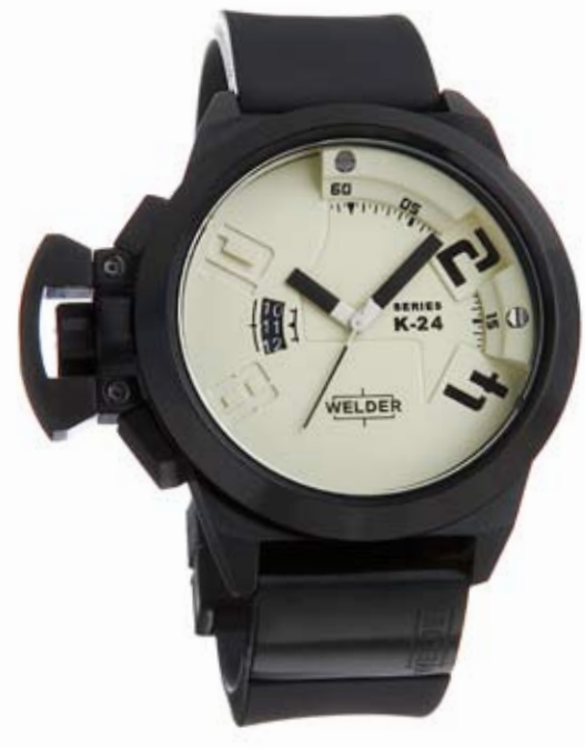
K24 3101 ø 48 mm

MOVEMENT: 8215 Miyota. FUNCTIONS: hours, minutes, seconds, date with immediate adjustment, positioned at nine o'clock. CASE: steel, AISI 316 L, IPB treatment. DIAMETER: 50 mm. DIAL: there are 2 superimposed black/beige dials. Arabic numerals, black/beige index and spheres. WATER RESISTANT: 10 ATM. STRAP: rubber, black, with IPB plate, butterfly buckle.