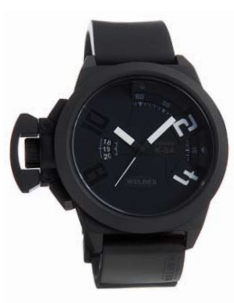
K24 3100 ø 50 mm