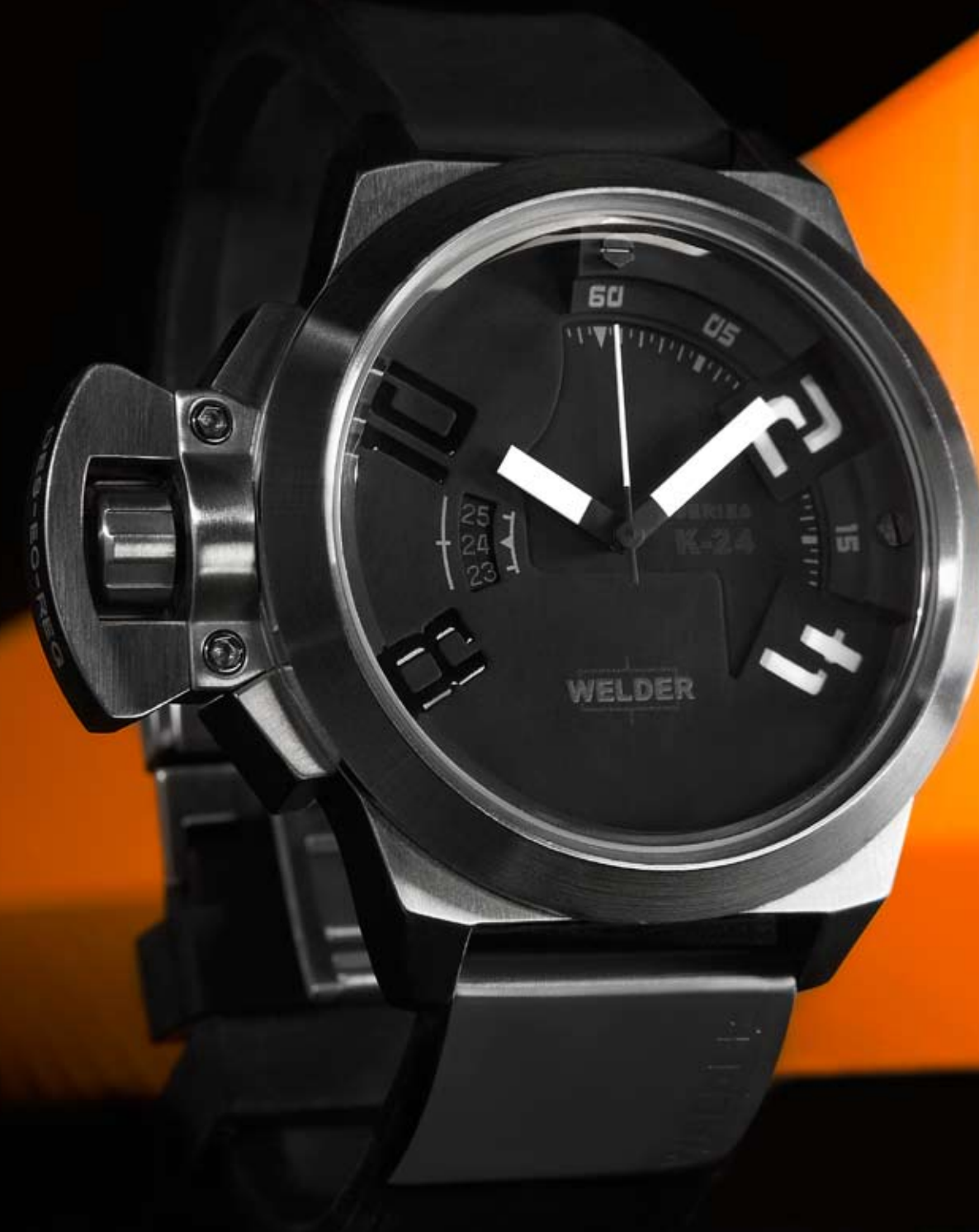
K24 3001 ø 50 mm

MOVIMENTO: 2115 Miyota. FUNZIONI: ore, minuti, secondi, data con correzione rapida alle ore 9. CASSA: in acciaio 316 L AISI. DIAMETRO: 50 mm. QUADRANTE: doppio quadrante, beige. Numeri arabi, sfere e indici neri. IMPERMEABILITÀ: 10 ATM. CINTURINO: caucciù, nero, con placca in acciaio, chiusura deployant.