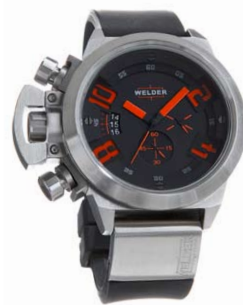
K24 3201 ø 50 mm