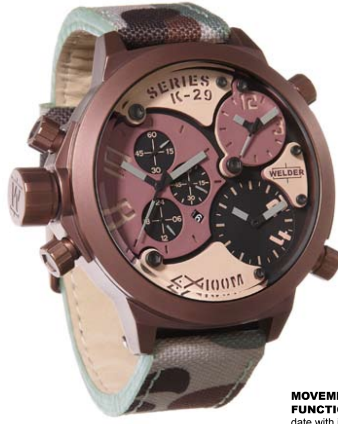
K29 8005 ø 53 mm

MOVIMENTI: Miyota FS10 / 2033 / 5Y20. FUNZIONI: ore, minuti, secondi, data con correzione rapida ore 9; ore, minuti e secondi con correzione ore 2; ore e minuti con correzione ore 4. CASSA: in acciaio 316 L AISI trattamento IPB marrone. DIAMETRO : 53 mm. QUADRANTE: sabbia, sfere e indici silver. IMPERMEABILITÀ: 10 ATM. CINTURINO: camouflage e pelle.