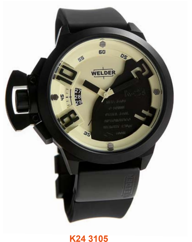
K24 3105 ø 50 mm

MOVEMENT: 8215 Miyota. FUNCTIONS: hours, minutes, seconds, date with immediate adjustment, positioned at nine o'clock. CASE: steel, AISI 316 L, IPB treatment. DIAMETER: 50 mm. DIAL: there are 2 superimposed carbon/black dials. Arabic numerals, black index and spheres. WATER RESISTANT: 10 ATM. STRAP: rubber, black, with IPB black plate, butterfly buckle.