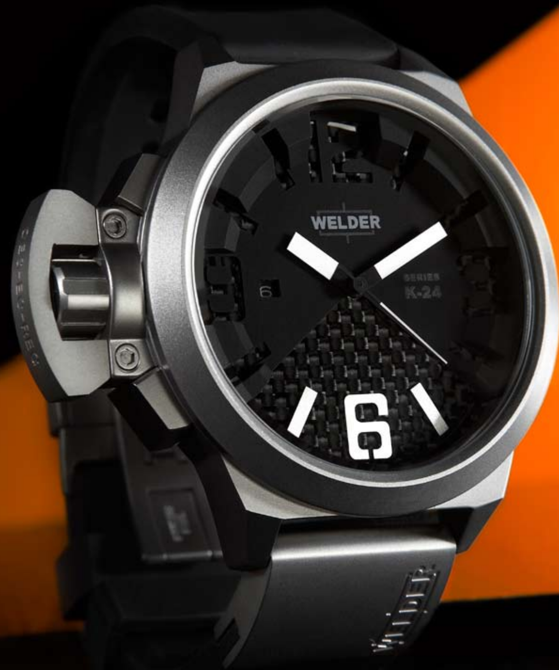
K24 3002 ø 50 mm

MOVEMENT: 8215 Miyota. FUNCTIONS: hours, minutes, seconds, date with immediate adjustment, positioned at nine o'clock. CASE: steel matt, AISI 316 L. DIAMETER: 50 mm. DIAL: there are 2 superimposed carbon/black dials. Arabic numerals, silver/black index and spheres. WATER RESISTANT: 10 ATM. STRAP: rubber, black, with steel matt plates, butterfly buckle.