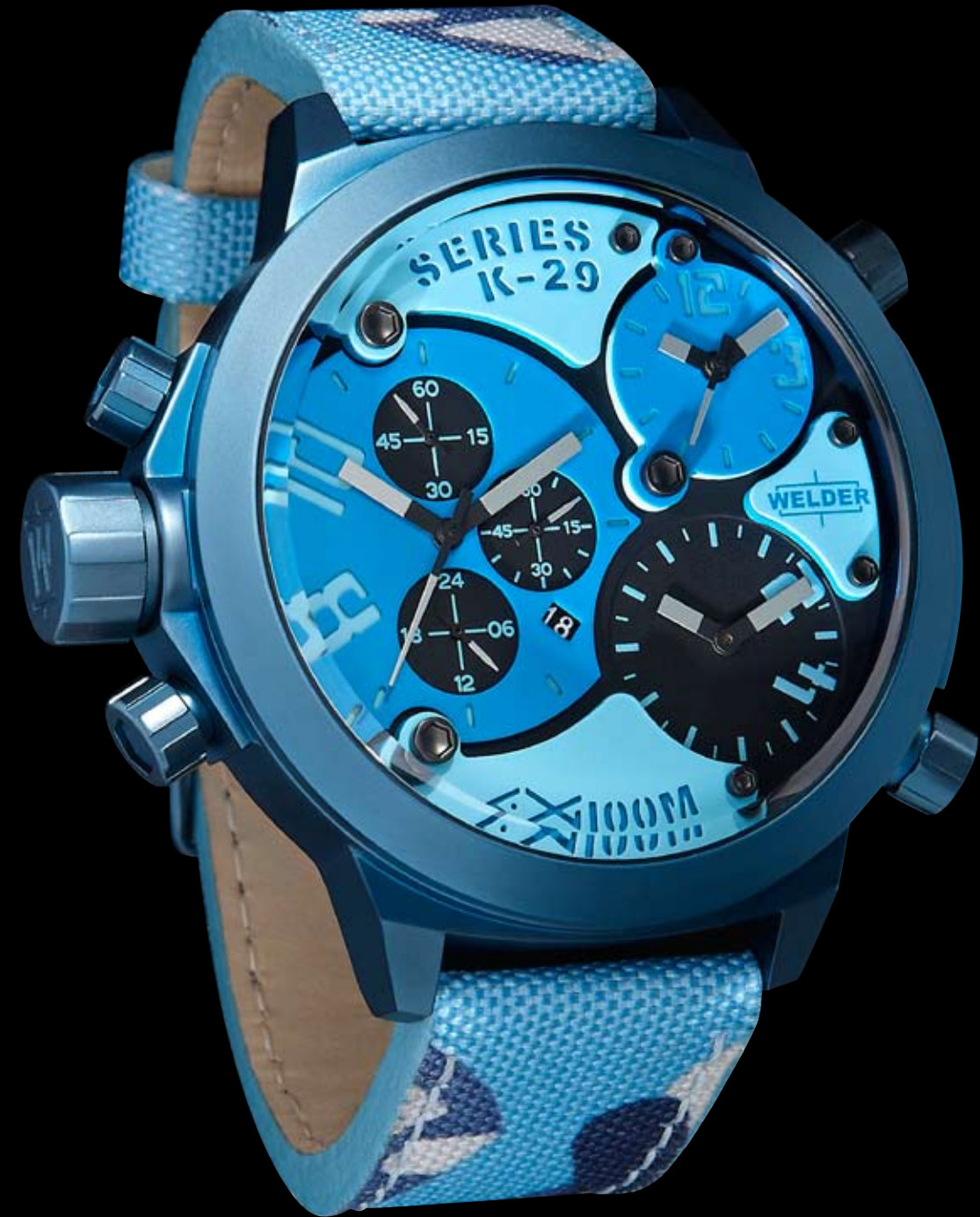
K29 8006 ø 53 mm

MOVIMENTI: Miyota FS10 / 2033 / 5Y20. FUNZIONI: ore, minuti, secondi, data con correzione rapida ore 9; ore, minuti e secondi con correzione ore 2; ore e minuti con correzione ore 4. CASSA: in acciaio 316 L AISI trattamento IPB blu. DIAMETRO : 53 mm. QUADRANTE: blu, sfere e indici silver. IMPERMEABILITÀ: 10 ATM. CINTURINO: camouflage e pelle.