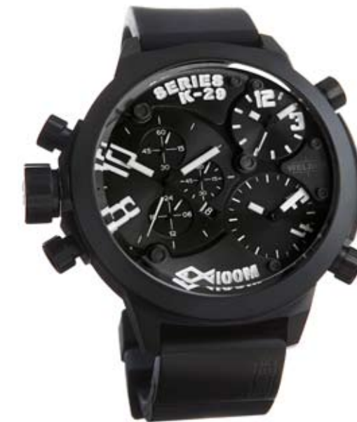
K29 8003 ø 53 mm