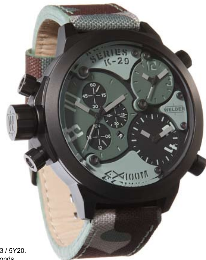
K29 8004 ø 53 mm

MOVIMENTI: Miyota FS10 / 2033 / 5Y20. FUNZIONI: ore, minuti, secondi, data con correzione rapida ore 9; ore, minuti e secondi con correzione ore 2; ore e minuti con correzione ore 4. CASSA: in acciaio 316 L AISI trattamento IPB nero. DIAMETRO : 53 mm. QUADRANTE: verde, sfere e indici silver. IMPERMEABILITÀ: 10 ATM. CINTURINO: camouflage e pelle.