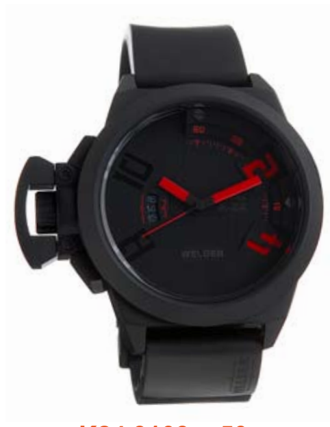
K24 3103 ø 50 mm

MOVIMENTO: 2115 Miyota. FUNZIONI: ore, minuti, secondi, data con correzione rapida alle ore 9. CASSA: in acciaio 316 L AISI, trattamento IPB. DIAMETRO: 50 mm. QUADRANTE: doppio quadrante, nero. Numeri arabi, sfere e indici bianco luminescente/verde/rosso. IMPERMEABILITÀ: 10 ATM. CINTURINO: caucciù, nero, con placca in acciaio, trattamento IPB, chiusura deployant.