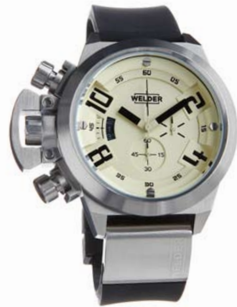
K24 3202 ø 50 mm

MOVIMENTO: OS10 Miyota cronografo. FUNZIONI: ore, minuti, secondi, data con correzione rapida alle ore 9. CASSA: in acciaio 316 L AISI. DIAMETRO: 50 mm. QUADRANTE: doppio quadrante, nero con numeri arabi indici e sfere bianco/arancio luminescente, beige con numeri arabi, sfere e indici neri. IMPERMEABILITÀ: 10 ATM. CINTURINO: caucciù, nero, con placca in acciaio, chiusura deployant.