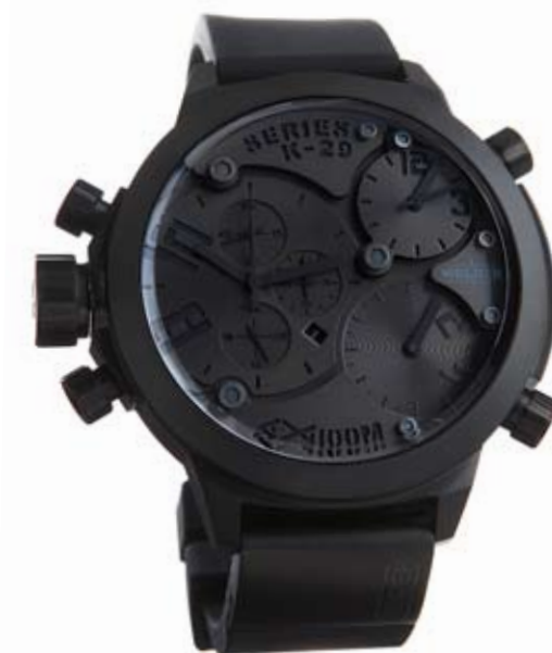
K29 8001 ø 53 mm

MOVIMENTI: Miyota FS10 / 2033 / 5Y20. FUNZIONI: ore, minuti, secondi, data con correzione rapida ore 9; ore, minuti e secondi con correzione ore 2; ore e minuti con correzione ore 4. CASSA: in acciaio 316 L AISI, trattamento IPB. DIAMETRO: 53 mm. QUADRANTE: silver o nero, sfere nere e indici silver o neri. IMPERMEABILITÀ: 10 ATM. CINTURINO: caucciù, nero, con placca in acciaio IPB, chiusura deployant.