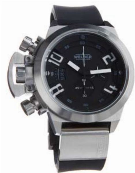
K24 3200 ø 50 mm