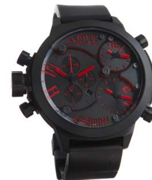
K29 8002 ø 53 mm

MOVEMENTS: Miyota FS10 / 2033 / 5Y20. FUNCTIONS: hours, minutes, seconds, date with immediate adjustment positioned at nine o'clock; hours, minutes, seconds positioned at two o'clock; hours and minutes positioned at four o'clock. CASE: steel, AISI 316 L, IP Black treatment. DIAMETER: 53 mm. DIAL: black. Red or white spheres and index. WATER RESISTANT: 10 ATM. STRAP: rubber, black, with IPB plate, butterfly buckle.