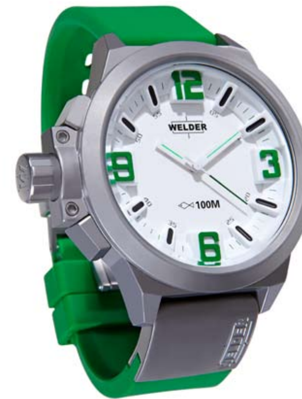
K22 903 ø 50 mm