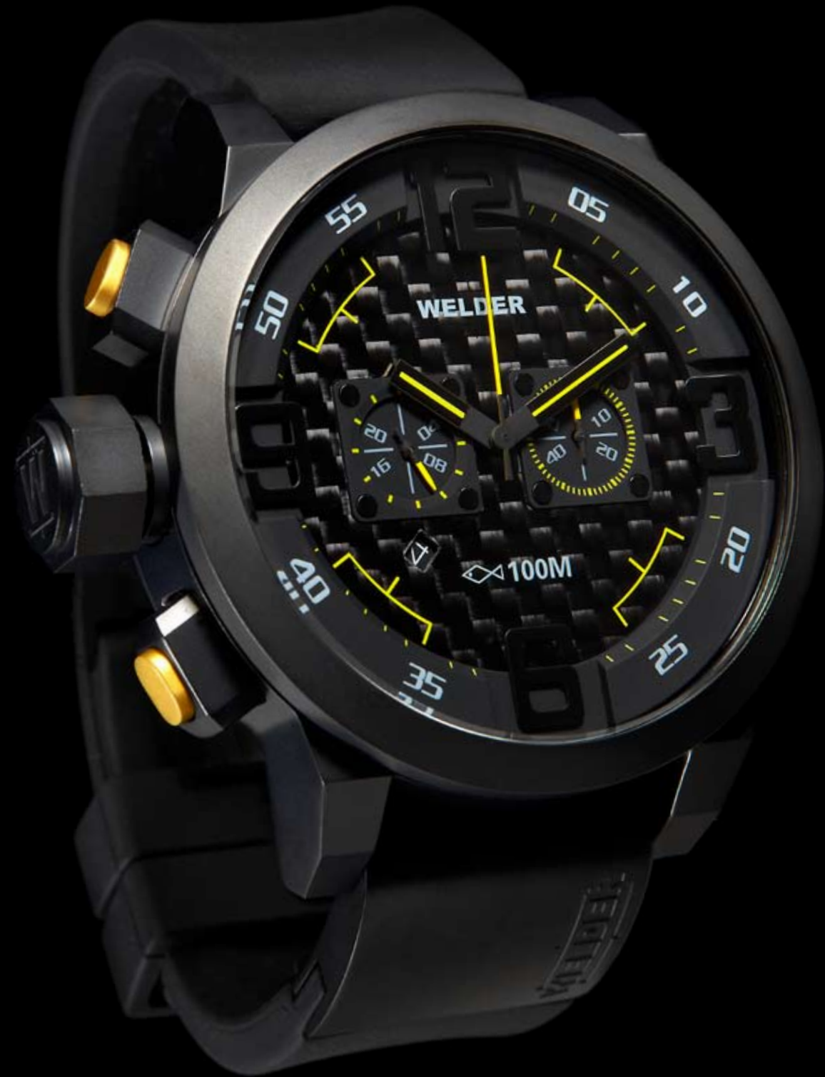
K31 10000 Ø 50 mm

MOVEMENT: Miyota OS21 chronograph. FUNZIONI: ore, minuti, secondi, data con correzione rapida alle ore 9. CASSA: in acciaio 316 L AISI, trattamento IPB. DIAMETRO: 50 mm. QUADRANTE: doppio quadrante nero/ carbonio. Numeri arabi, sfere nero/giallo e indici nero/bianco. IMPERMEABILITÀ: 10 ATM. CINTURINO: caucciù, nero, con placca in acciaio IPB, chiusura deployant.