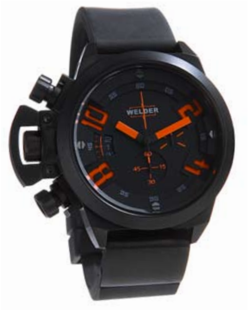
K24 3300 ø 50 mm