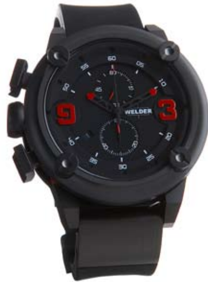
K28 7100 ø 50 mm

MOVIMENTO: OS10 Miyota cronografo. FUNZIONI: ore, minuti, secondi, data con correzione rapida alle ore 9. CASSA: in acciaio 316 L AISI o acciaio trattamento IPB. DIAMETRO: 50 mm. QUADRANTE: doppio quadrante, nero. Numeri arabi, sfere e indici bianchi o rossi. IMPERMEABILITÀ: 10 ATM. CINTURINO: caucciù, nero, con placca in acciaio, o acciaio IPB, chiusura deployant.