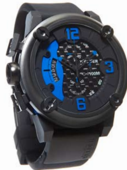
K28 7103 ø 50 mm

MOVIMENTO: OS10 Miyota cronografo. FUNZIONI: ore, minuti, secondi, data con correzione rapida alle ore 9. CASSA: in acciaio 316 L AISI, trattamento IPB. DIAMETRO: 50 mm. QUADRANTE: doppio quadrante, nero. Numeri arabi, sfere nere e indici blu. IMPERMEABILITÀ: 10 ATM. CINTURINO: caucciù, nero, con placca in acciaio IPB, chiusura deployant.