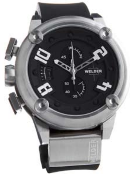
K28 7000 ø 50 mm