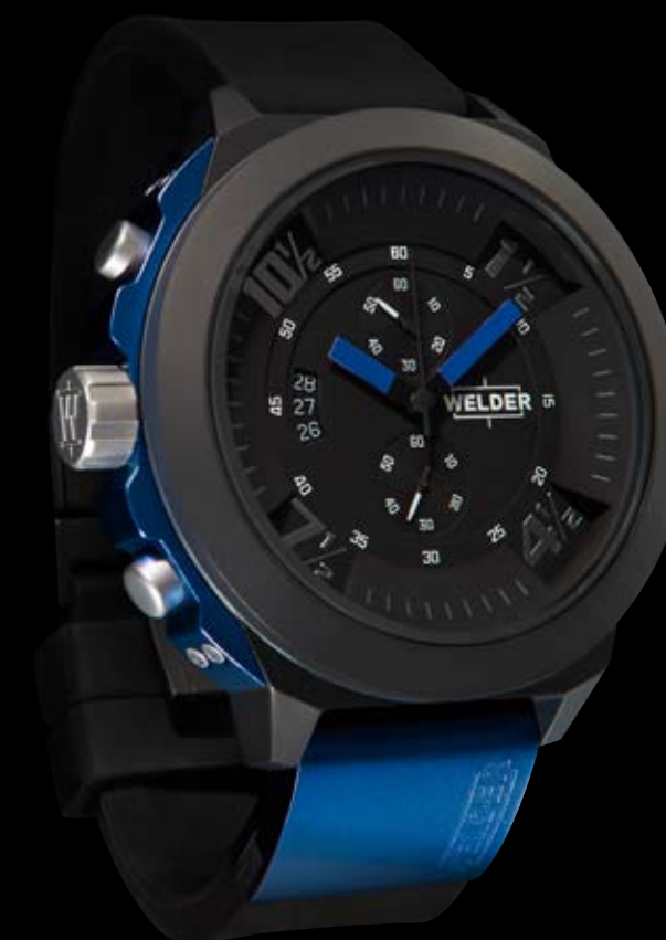
K33 9302 ø 50 mm