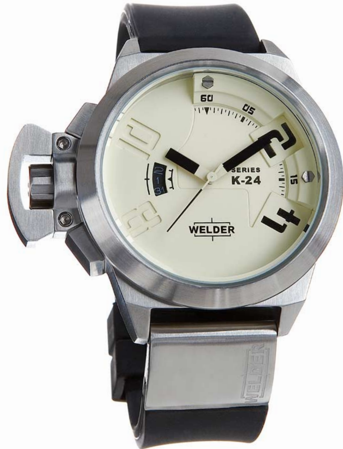
K24 3000 ø 50 mm

MOVEMENT: 2115 Miyota. FUNCTIONS: hours, minutes, seconds, date with immediate adjustment, positioned at nine o'clock. CASE: steel, AISI 316 L. DIAMETER: 50 mm. DIAL: there are 2 superimposed beige dials. Arabic numerals, black spheres and index. WATER RESISTANT: 10 ATM. STRAP: rubber, black, with steel plate, butterfly buckle.