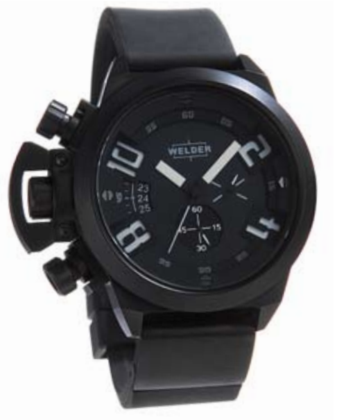
K24 3301 ø 50 mm

MOVIMENTO: OS10 Miyota cronografo. FUNZIONI: ore, minuti, secondi, data con correzione rapida alle ore 9. CASSA: in acciaio 316 L AISI, trattamento IPB. DIAMETRO: 50 mm. QUADRANTE: doppio quadrante, nero con numeri arabi indici e sfere bianco/arancio luminescente, beige con numeri arabi, sfere e indici neri. IMPERMEABILITÀ: 10 ATM. CINTURINO: caucciù, nero, con placca in acciaio, chiusura deployant.