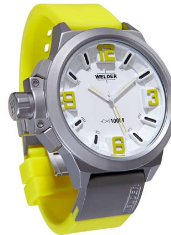
K22 902 ø 50 mm

MOVEMENT: Miyota 2035. FUNCTIONS: hours, minutes, seconds. CASE: steel, AISI 316 L. DIAMETER: 50 mm. DIAL: white dial. Yello/green/blue/orange Arabic numerals. WATER RESISTANT: 10 ATM. STRAP: orange, yello, green, blue rubber, with steel plates, butterfly buckle.