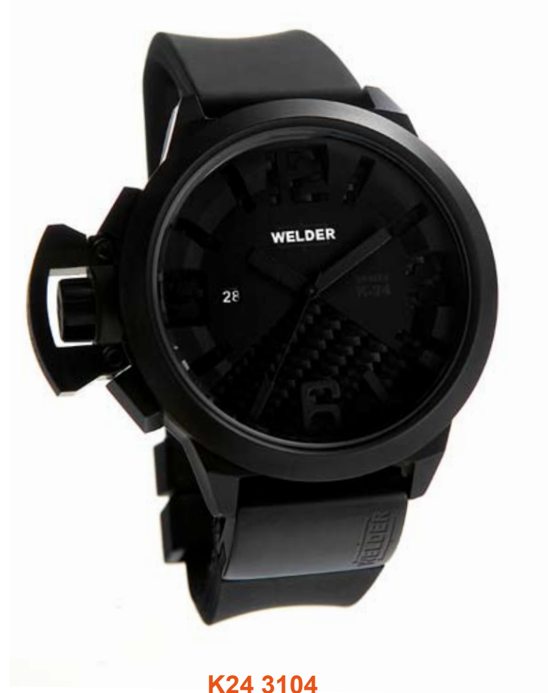
K24 3104 ø 50 mm

MOVEMENT: 2115 Miyota. FUNCTIONS: hours, minutes, seconds, date with immediate adjustment, positioned at nine o'clock. CASE: steel, AISI 316 L, IPB treatment. DIAMETER: 50 mm. DIAL: there are 2 superimposed black dials. Arabic numerals, luminous white/green/red spheres and index. WATER RESISTANT: 10 ATM. STRAP: rubber, black, with steel plates, IPB treated, butterfly buckle.