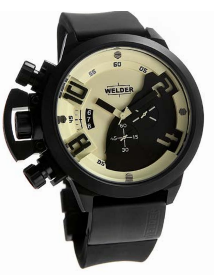
K24 3305 ø 50 mm

MOVEMENT: OS10 Miyota chronograph. FUNCTIONS: hours, minutes, seconds, date with immediate adjustment, positioned at nine o'clock. CASE: steel, AISI 316 L, IPB treatment. DIAMETER: 50 mm. DIAL: there are 2 superimposed black dials with luminous white/orange arabic numerals, spheres and index, or 2 superimposed beige dials with black arabic numerals, spheres and index. WATER RESISTANT: 10 ATM. STRAP: rubber, black, with steel plate, butterfly buckle.