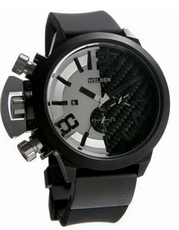
K24 3307 ø 50 mm

MOVIMENTO: OS10 Miyota cronografo. FUNZIONI: ore, minuti, secondi, data con correzione rapida alle ore 9. CASSA: in acciaio 316 L AISI, trattamento IPB. DIAMETRO: 50 mm. QUADRANTE: doppio quadrante beige con numeri arabi, sfere e indici neri. IMPERMEABILITÀ: 10 ATM. CINTURINO: caucciù, nero, con placca in acciaio, chiusura deployant.