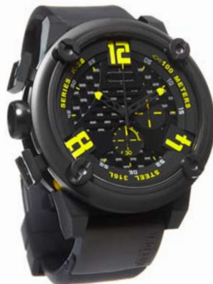
K28 7104 ø 50 mm

MOVEMENT: OS30 Miyota chronograph. FUNCTIONS: hours, minutes, seconds, CASE: steel, AISI 316 L IPB treatment. DIAMETER: 50 mm. DIAL: there are 2 superimposed black dials. Arabic numerals, yellow index and black/blue or black spheres. WATER RESISTANT: 10 ATM. STRAP: rubber, black, with IPB plate, butterfly buckle.