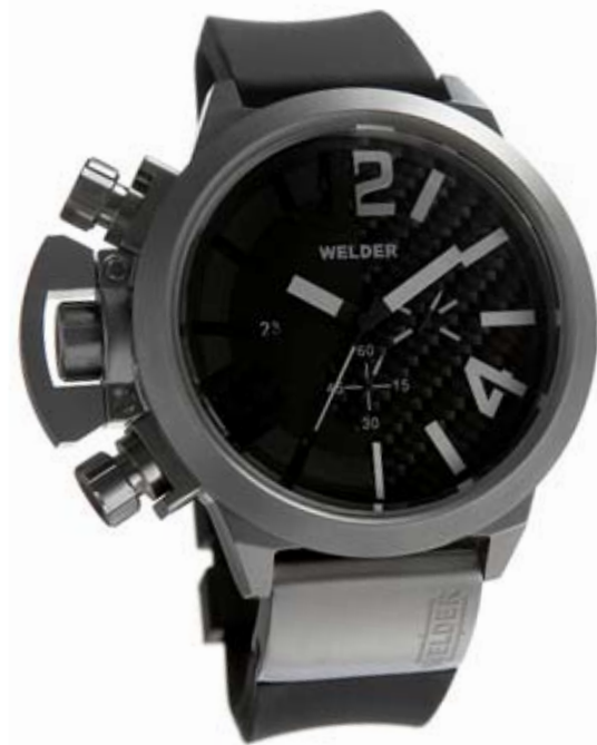
K24 3204 ø 50 mm

MOVEMENT: OS10 Miyota chronograph. FUNCTIONS: hours, minutes, seconds, date with immediate adjustment, positioned at nine o'clock. CASE: steel, AISI 316 L. DIAMETER: 50 mm. DIAL: there are 2 superimposed black dials with luminous white/orange arabic numerals, spheres and index, or 2 superimposed beige dials with black arabic numerals, spheres and index. WATER RESISTANT: 10 ATM. STRAP: rubber, black, with steel plate, butterfly buckle.