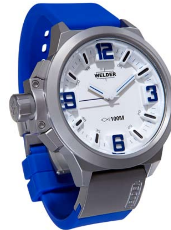
K22 904 ø 50 mm