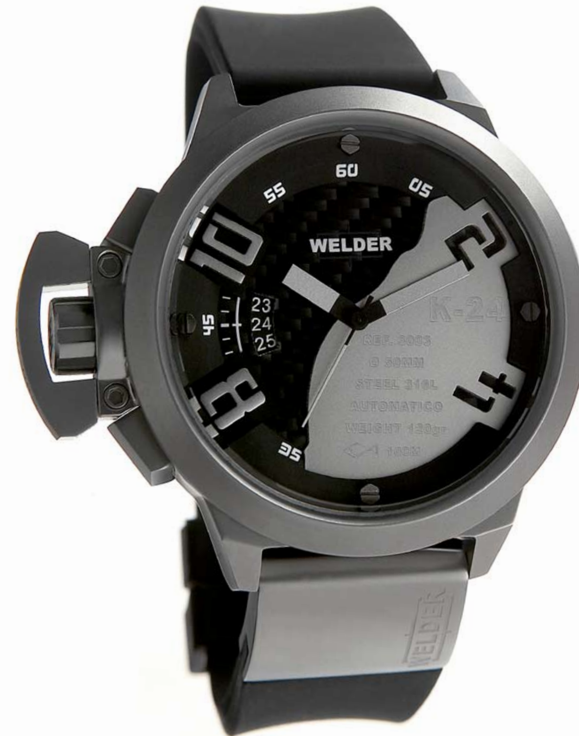
K24 3003 ø 50 mm

MOVIMENTO: 8215 Miyota. FUNZIONI: ore, minuti, secondi, data con correzione rapida alle ore 9. CASSA: in acciaio matt 316 L AISI. DIAMETRO: 50 mm. QUADRANTE: doppio quadrante, carbonio/nero. Numeri arabi, sfere e indici silver/neri. IMPERMEABILITÀ: 10 ATM. CINTURINO: caucciù, nero, con placca in acciaio matt, chiusura deployant.