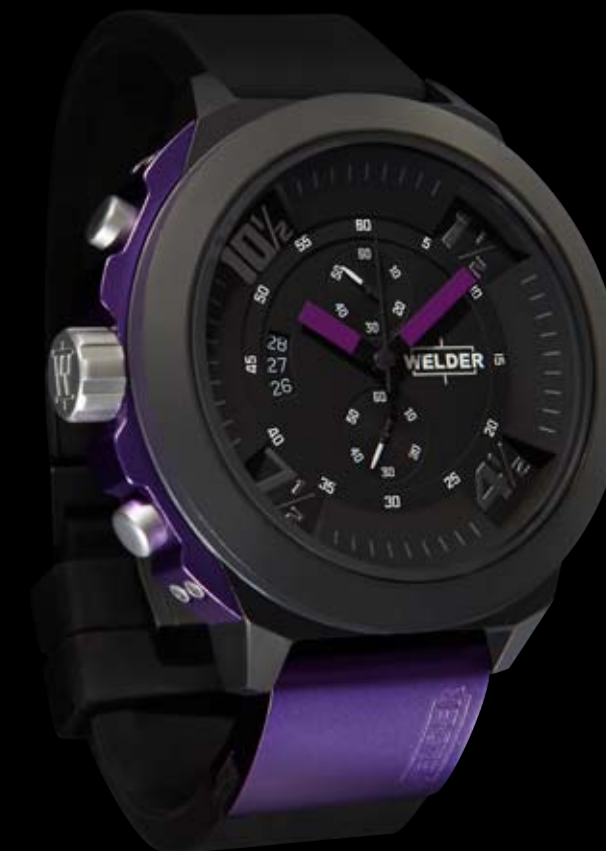
K33 9303 ø 50 mm

MOVEMENT: Miyota OS11. FUNCTIONS: hours, minutes, seconds, date with immediate adjustment positioned at 9 o'clock. CASE: steel, AISI 316 L IPB black treatment, coloured aluminium insert red/purple/blue. DIAMETER: 50 mm. DIAL: black. Spheres and index red/blue/purple. WATER RESISTANT: 10 ATM. STRAP: rubber, black, with IPB plate, butterfly buckle.