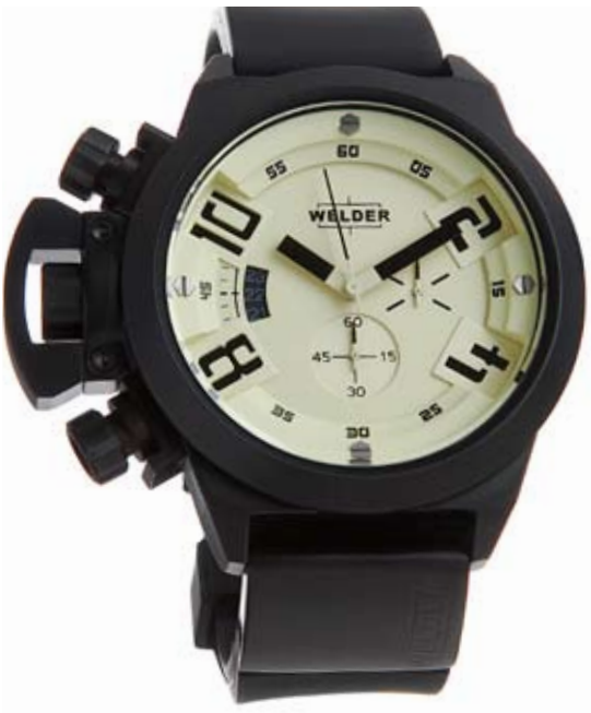
K24 3302 ø 50 mm

MOVIMENTO: Miyota OS1A cronografo. FUNZIONI: ore, minuti, secondi, data con correzione rapida alle ore 9. CASSA: in acciaio 316 L AISI, trattamento IPB. DIAMETRO: 50 mm. QUADRANTE: doppio quadrante, nero/beige. IMPERMEABILITÀ: 10 ATM. CINTURINO: caucciù, nero, con placca in acciaio, trattamento IPB, chiusura deployant.