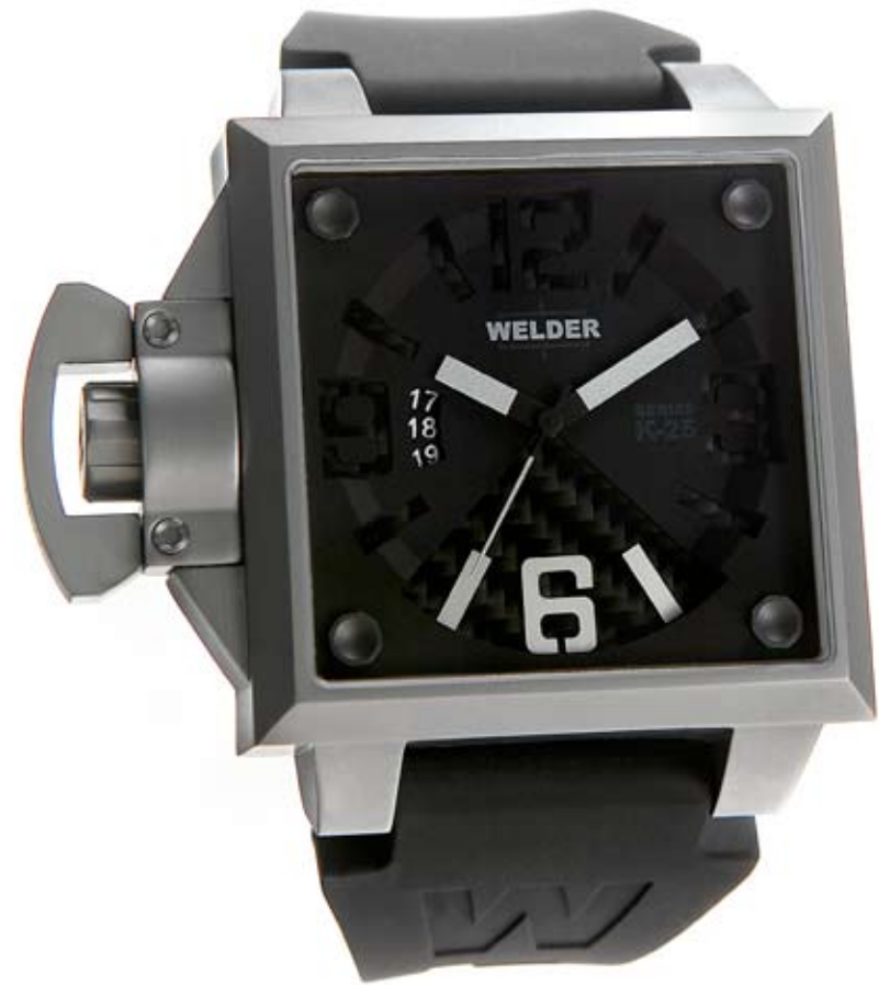
K25 4003 46x46 mm K25 4403 40x40 mm

MOVIMENTO: 2115 Miyota. FUNZIONI: ore, minuti, secondi, data con correzione rapida alle ore 9. CASSA: in acciaio matt 316 L AISI DIMENSIONI: 46x46 mm e 40x40 mm. QUADRANTE: doppio quadrante, carbonio/nero. Numeri arabi, sfere e indici silver/carbonio o nero/carbonio. IMPERMEABILITÀ: 5 ATM. CINTURINO: caucciù, nero.