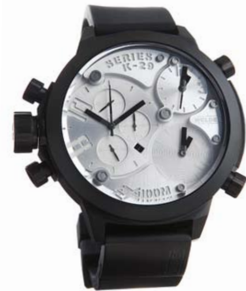
K29 8000 ø 53 mm