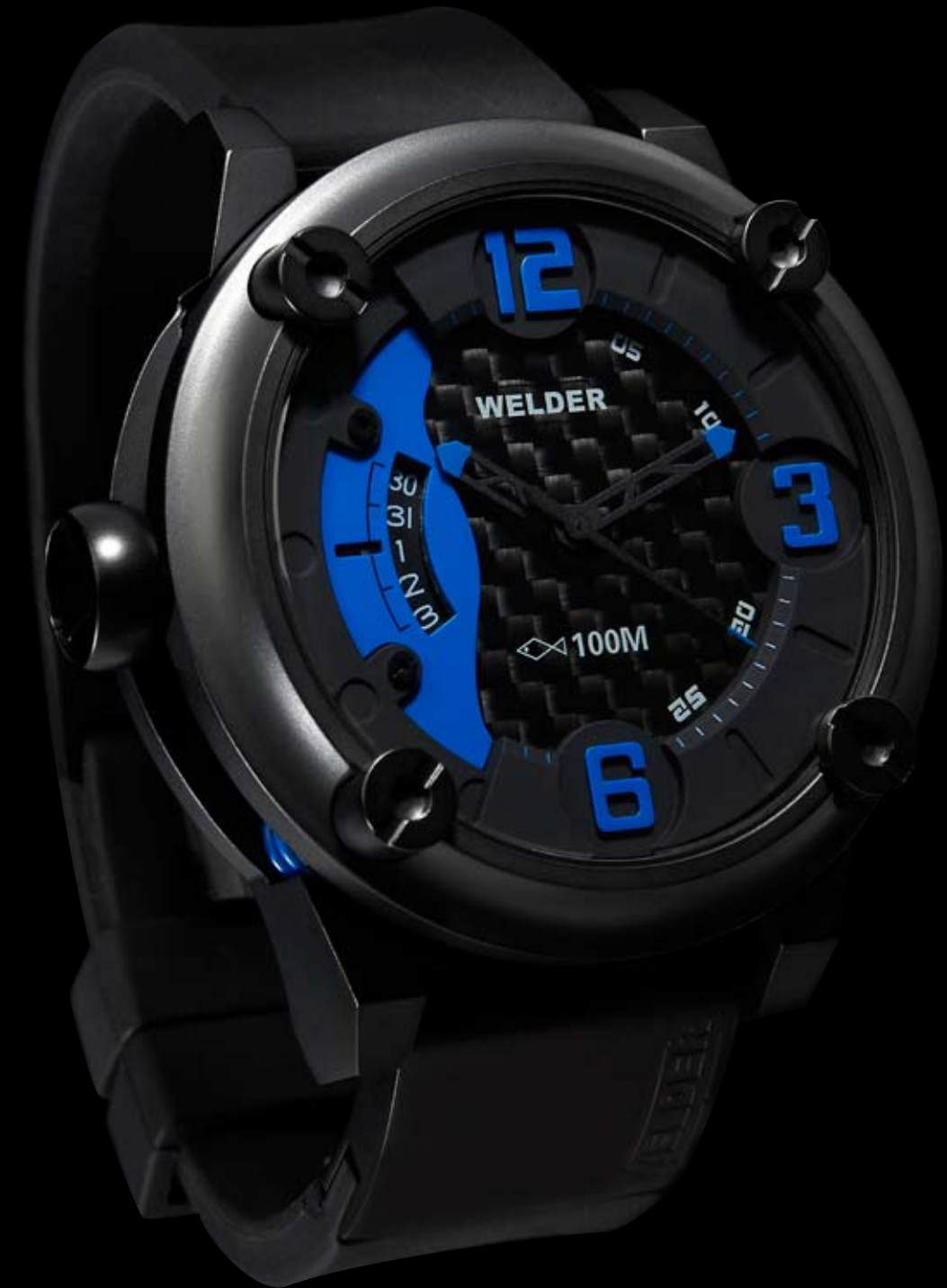
K28 7303 ø 50 mm

MOVIMENTO: 8215 Miyota. FUNZIONI: ore, minuti, secondi, data con correzione rapida alle ore 9. CASSA: in acciaio 316 L AISI, trattamento IPB. DIAMETRO: 50 mm. QUADRANTE: doppio quadrante, nero. Numeri arabi, sfere nere e indici blu. IMPERMEABILITÀ: 10 ATM. CINTURINO: caucciù, nero, con placca in acciaio IPB, chiusura deployant.